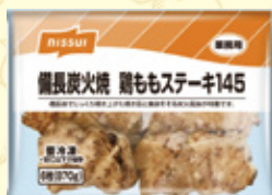
備長炭火焼鶏ももステーキ145