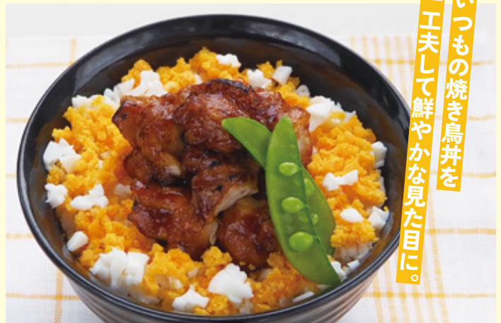
いつもの焼き鳥丼を 一工夫して鮮やかな見た目に。