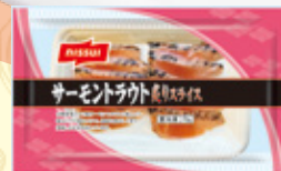
サーモンラウト 炙りスライス