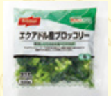
エクアドル産 ブロッコリー