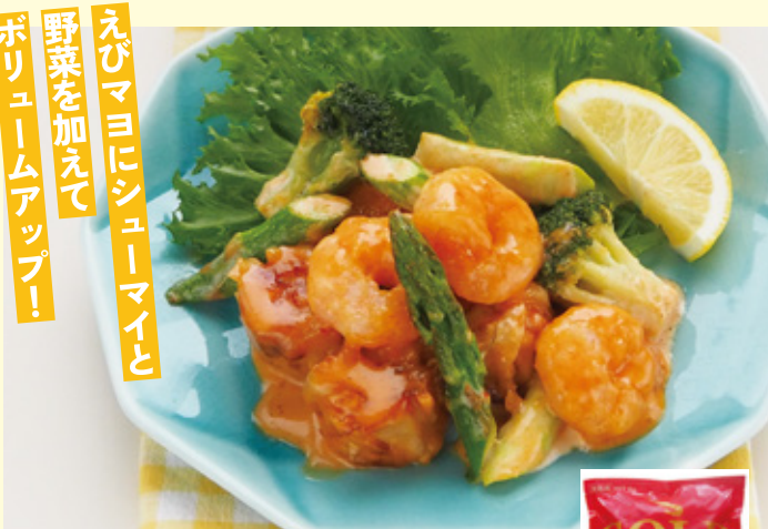
えびマヨにシューマイと 野菜を加えて ボリュームアップ!