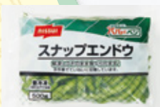
スナップエンドウ