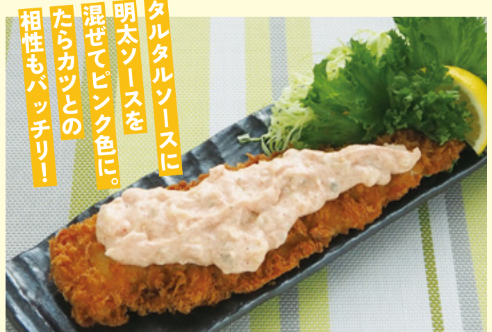
タルタルソースに 明太ソースを 混ぜてピンク色に。 たらカツとの 相性もバッチリ!