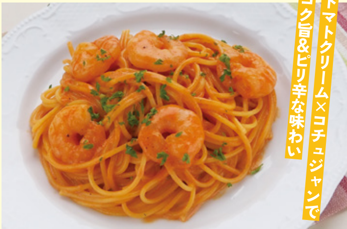
トマトクリーム×コチュジャンで コク旨&ピリ辛な味わい