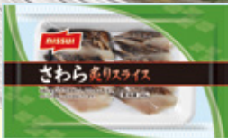
さわら炙りスライス