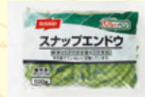
スナップエンドウ