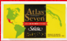
メキシコホワイト有頭 70-90

こちらもハワイの定番メニュー。 パンチのあるガーリックソースとえびの組み合わせは ご飯だけでなくおつまみにもピッタリ!