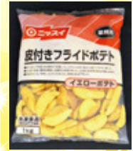
皮付きフライドポテト