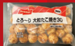
とろ〜り大粒たこ焼き 30