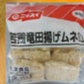
若鶏竜田揚げムネ 90

NYで人気の屋台メニュー。 アレンジは自由自在ですが、 ボリューム感のあるチキンカツを トッピングすればインパクト抜群!