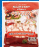
SHRIMP PRO サラダえび 31-40